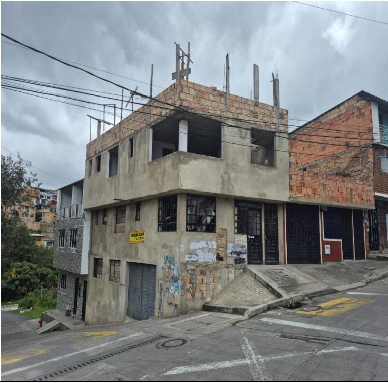
IMAGEN 3: FACHADA LATERAL